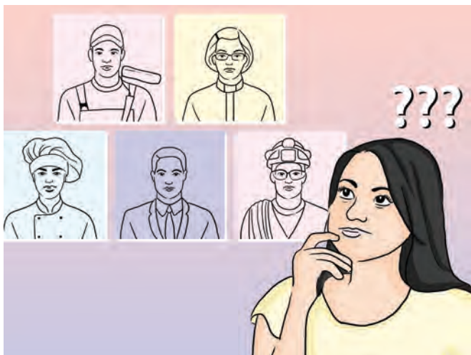
Gambar 14.2 Cita-citaku di tangan Tuhan