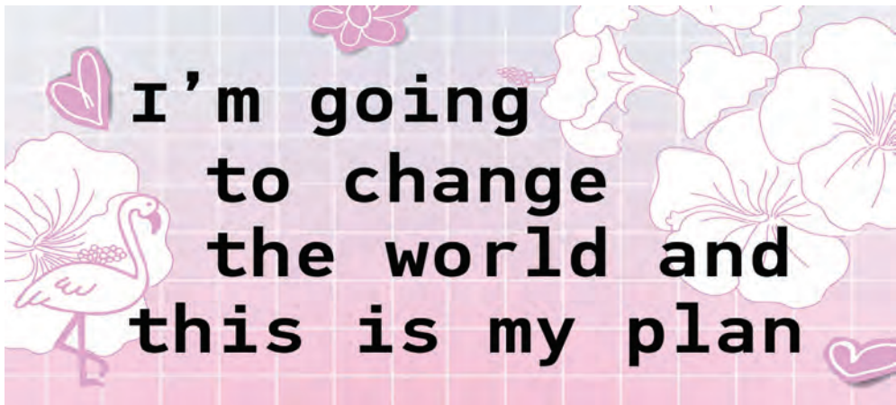
Gambar 14.1 Going to change

Bahan Alkitab: Mazmur 1:1-3; Amsal 23:18; Amsal 19:21; Yakobus 4:13-17; Yeremia 29:11